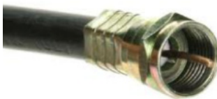
Zo ziet uw coax aansluiting eruit

Controleer nu op uw oude ontvanger of u nog steeds gewoon beeld heeft op de regionale zenders. Heeft u beeld, dan kan u verder gaan met stap 2.