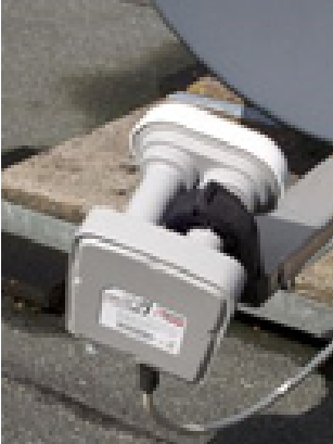
Zo moet u de Duo LNB vastklemmen

U kunt uw oude LNB vervangen door de Duo LNB, zonder dat uw schotel opnieuw uitgericht dient te worden.