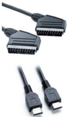
Boven: Scart Onder: HDMI

Uw oude ontvanger zal waarschijnlijk aangesloten zijn met een scart kabel. Indien u beschikt over een 'platte' TV dan heeft dit toestel waarschijnlijk een HDMI aansluiting.